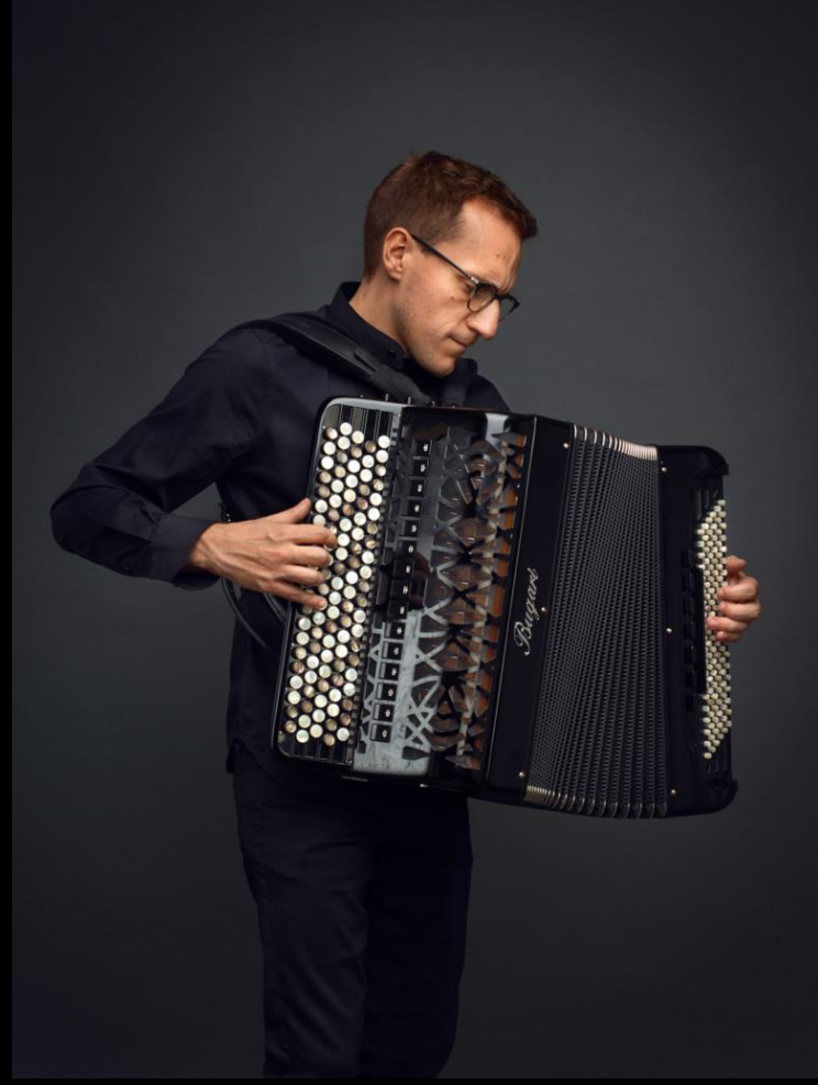
ACORDÉON FÉLICIEN BRUT felicienbrut.com